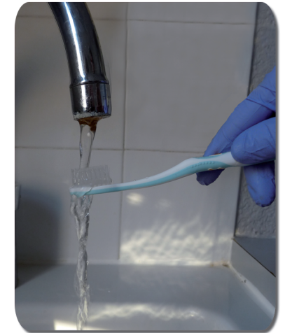
Rincer la brosse à dent