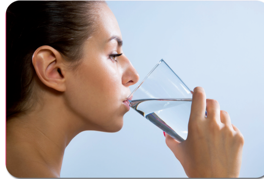
Rincer la bouche