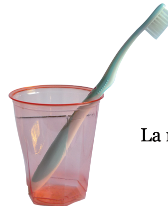
La ranger à l'air libre

(La nuit la production salivaire diminue et les bactéries se multiplient)