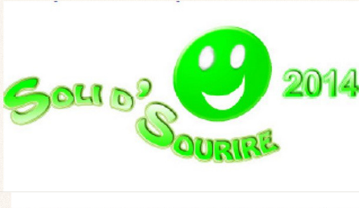
L'association Santé Orale, Handicap, Dépendance Et Vulnérabilité (SOHDEV) coordonne du 30 juin au 11 juillet 2014, la manifestation Soli' Sourire, axée sur la santé bucco-dentaire des personnes en situation de précarité.